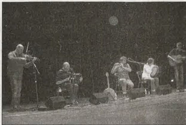
Le groupe Shelta sur scène a donné un concert fleurant bon les vertes prairies irlandaises

Dans le contexte actuel difficile au niveau international, mardi soir, au Nec, le Groupe Shelta a offert aux spectateurs une vraie bouffée d'air pur avec un voyage dans les vertes prairies irlandaises.